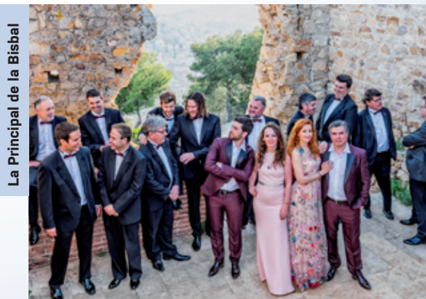
La Principal de la Bisbal

20.30 h: Ball ► La Principal de la Bisbal. Entrades a la venda a: andorralavella.ad/entrades [Plaça del Poble]