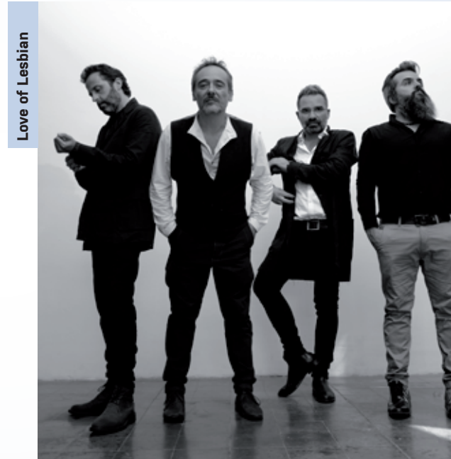
Love of Lesbian

20.30 h: El concert de la Festa Major: ► Love of Lesbian. Entrades a la venda a: andorralavella.ad/entrades [Aparcament parc Central]