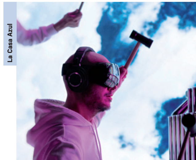
La Casa Azul